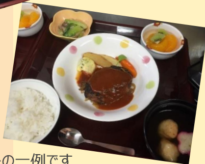
メニューの一例です